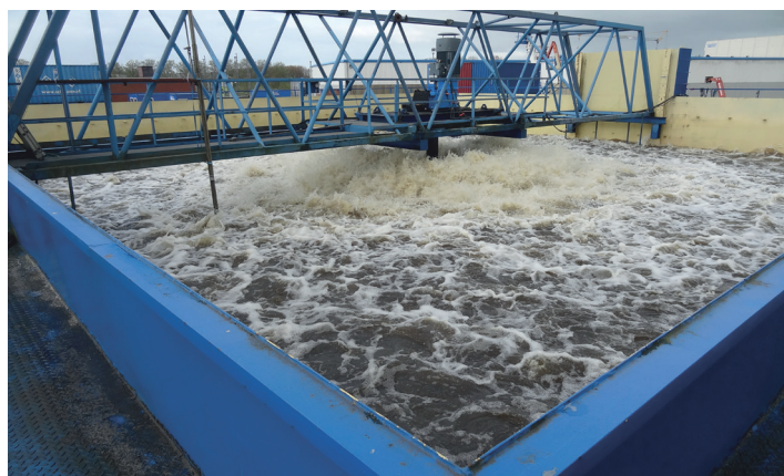
eigen full-scale testtank

Het nieuwe type is geen opvolger van de LANDY-7 maar vormt een aanvulling op de totale range aan oppervlaktebeluchters.